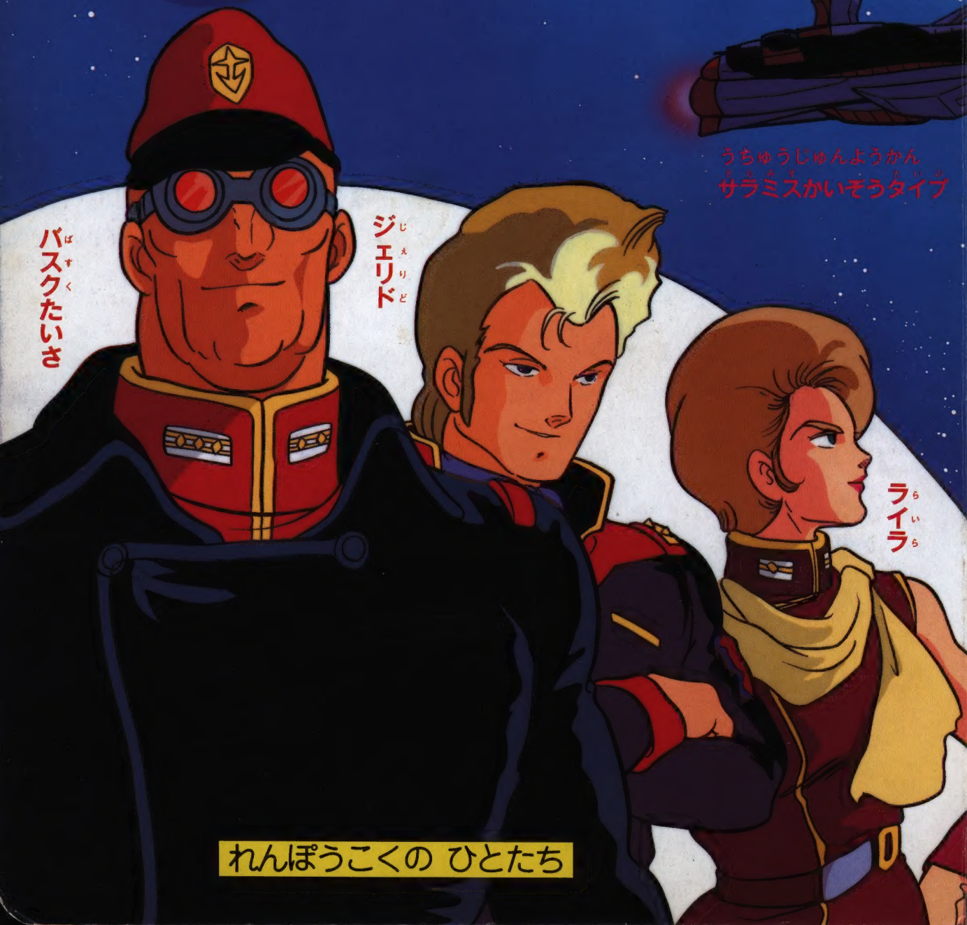
バスケット たいさ